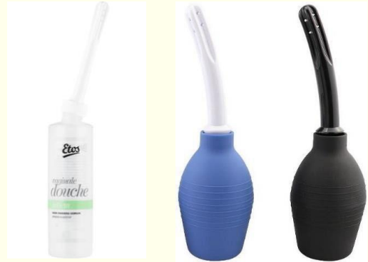
Vaginaal irrigator/Vaginale douche